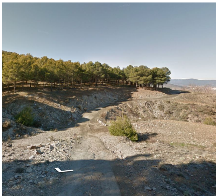
Imagen procedente de Google Street View, a la altura de final de término municipal de Aldeire.