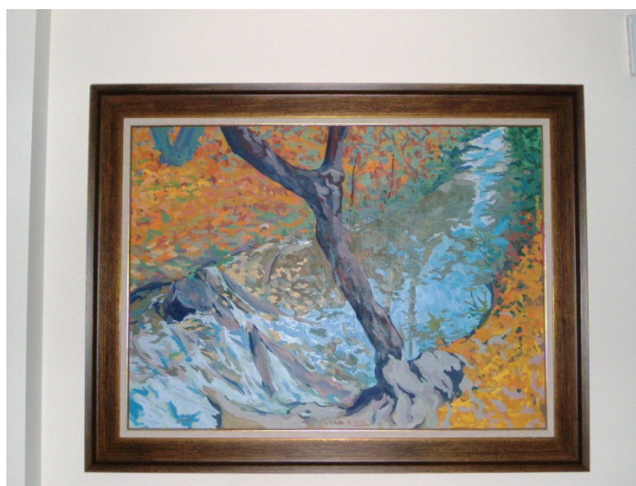
Cuadro de colección