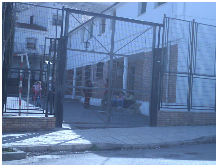
4 Viviendas Desafectadas en Recinto Escolar