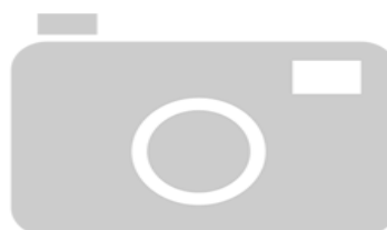
IMAGEN NO DISPONIBLE