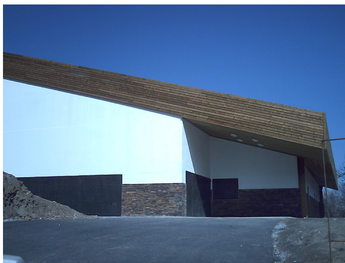
Finca urbana reparcelada, nº 2