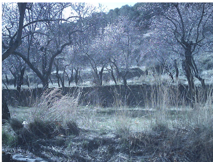
Tierra de riego