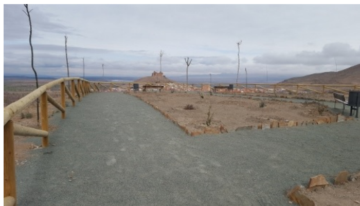
Mirador Paraje Las Zorreras