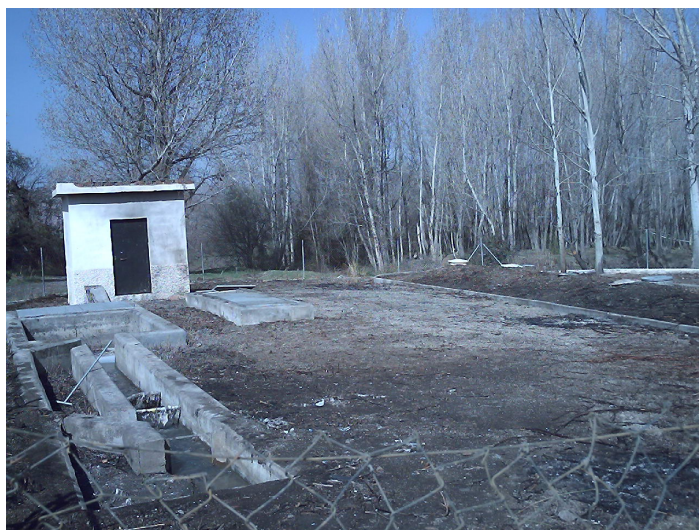
Depuradora de Aguas Residuales