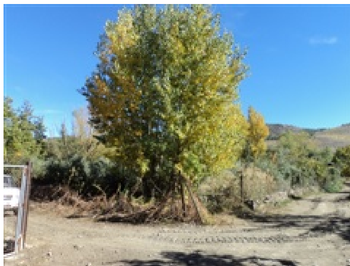
Parcela Rústica Nº 58 del Polígono 12 de Aldeire