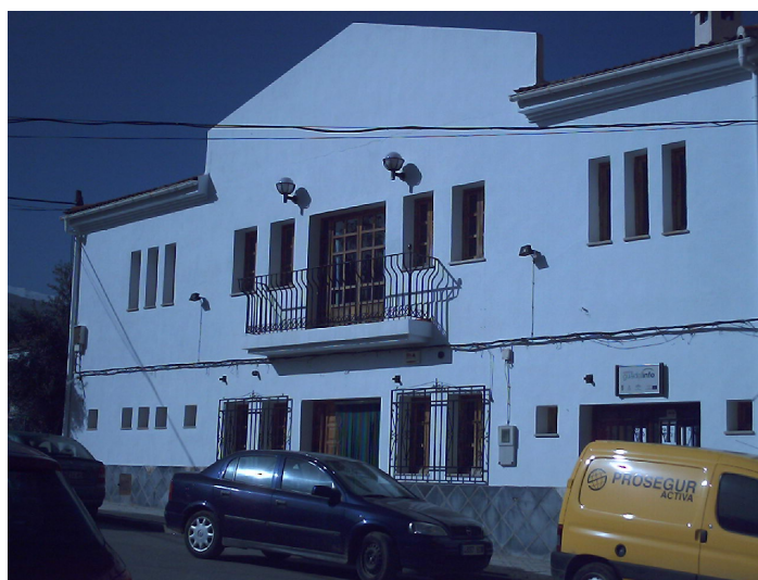
Edificio de usos múltiples