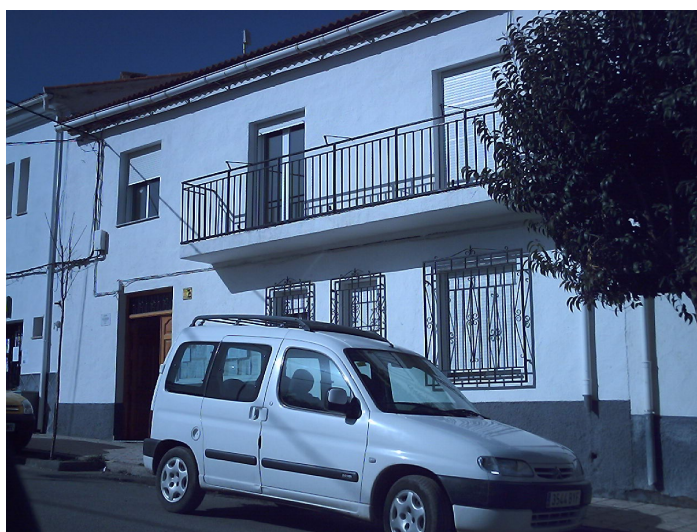
Casa dos plantas