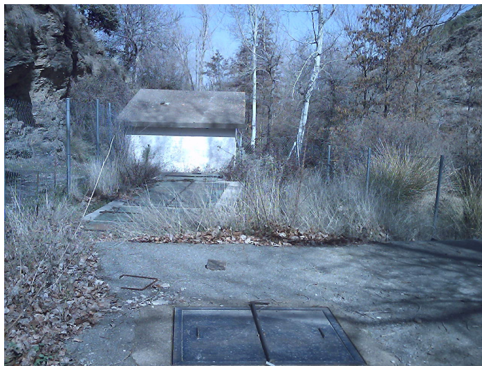
Instalaci3n de captaci3n de Agua Potable