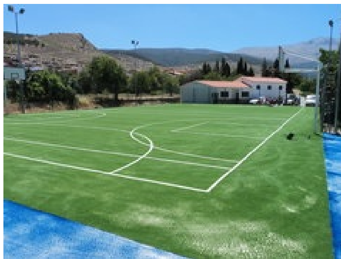
Pista Polideportiva y Vestuarios